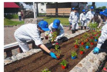
(赤い靴公園での様子)