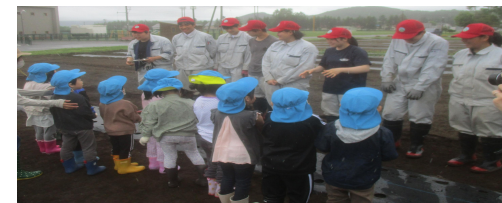
(るすつ子どもセンターぼっけの皆さんと)

6月13日（火）に本校生徒と「るすつ子どもセンターぼっけ」の皆さんとの農業交流を行いました。今回の交流ではスイートコーンとエダマメの播種を行いました。交流では高校生のお話をよく聞き積極的に活動をしてくださいました。次は収穫です。また一緒に、楽しく交流をしましょう！