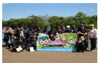
⑤大沼公園でのウォークラリー