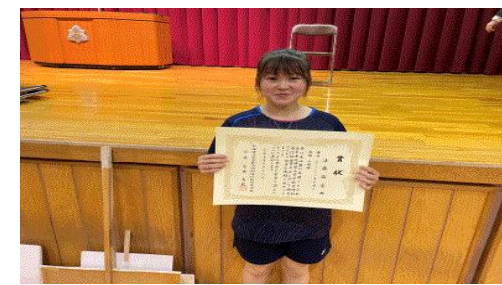
(バドミントン大会にて)