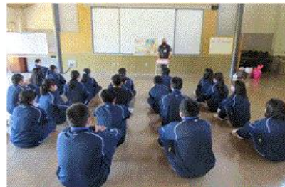
②職員さんとの入所式