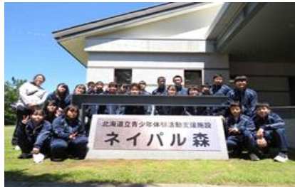
①ネイパル森に到着

6月19日(月)～20日(火) ネイパル森を会場に1学年宿泊研修を実施しました。研修には22名が参加し、入所式や職員さんによるアイスブレイク、火おこし体験や野外炊飯、ウォークラリーなど班員の皆と協力し合い活動していました。2日間と短い時間でしたが、お互いを認め合い、協力し活動する姿は一学年の団結が見られました。この経験をこれから始まる学校行事や自分の進路活動に活かしてくれると思います。皆さんお疲れさまでした。