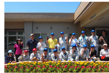
(福祉施設での様子)